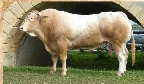
JUNIO Sedan 2019

JUNIO , le père d'OASIS est un taureau exceptionnel, il était RRJ* en Station et a très bien porté et confirmé sa suprématie à la fois dans la morphologie (pointé 84A) et toujours sur le podium mais aussi sur ses index à 117 IVMAT dont 102 en Fnais et 109 en DMsev.