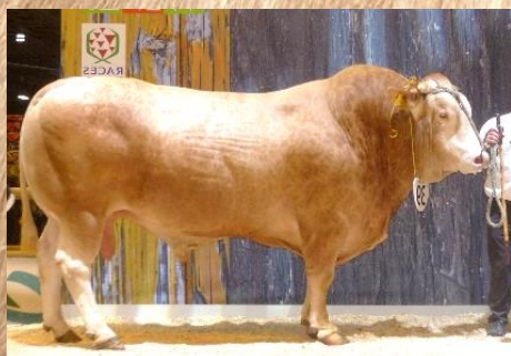
IVAN Champion adulte - Paris 2018