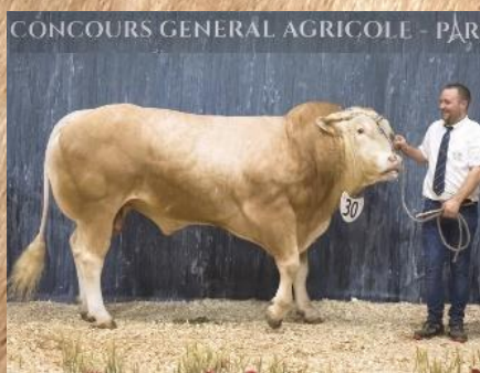
MALINOIS Paris 2019