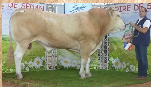
LEROI Champion Sedan 2018