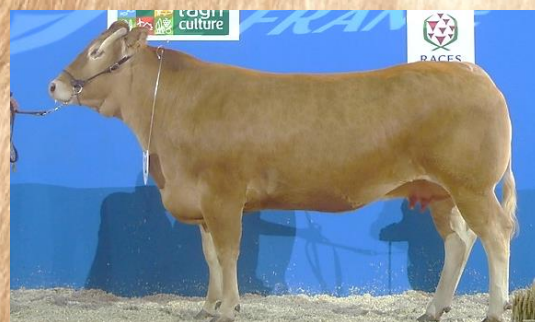
FELINDRA Paris 2015

Ce superbe montage génétique IVAN par FELINDRA est exceptionnel de qualité et de puissance à 85A de moyenne sur le pointage OS, IVAN est le Champion de Paris 2018, il montre une production très haut de gamme et FELINDRA fille de DOMY par TODRA qui est une vache emblématique de l'élevage SAZY. OLERON est un taureau mixte, très long de corps, avec un bassin bien équilibré qui respecte les spécificités ancestrales de la race. Il est également très fonctionnel sur ses membres et sa rectitude de dos.