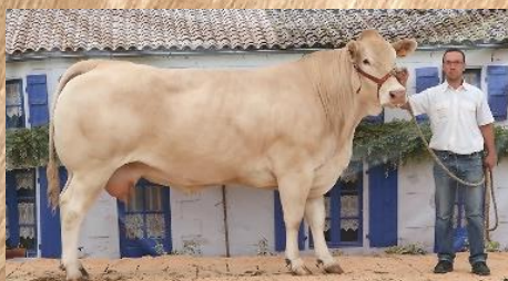
HARMONIE à Moncoutant