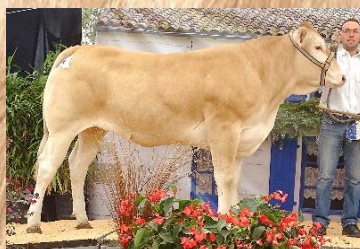
NINA sa propre sœur