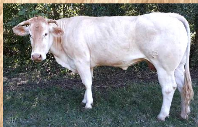
LUCKYSTRIKE fille de GAULOISE