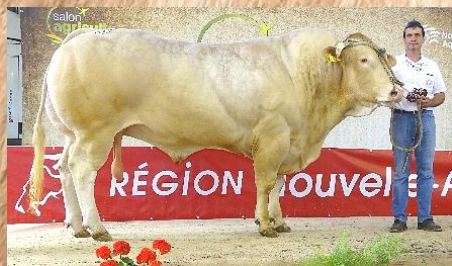
JUNIO AQUITANIMA 2019