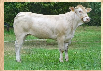
MOUETTE sa propre sœur

NAPLE est une génisse au pedigree ayant déjà fait ses preuves. En effet, elle est la sœur de MOUETTE qui s'est illustrée au Concours National de Moncoutant en 2018. De son père GUERNICA elle a hérité le style, l'élégance et la blondeur quant à sa mère CAPRI , c'est une raceuse hors normes qui lui a transmis sa tête expressive et son dessin musculaire . C'est une génisse montante, stylée, promise à un très bel avenir sur les podiums mais également au travers de sa production au vu des index très intéressants qu'elle affiche. Nul doute qu'elle sera une véritable tête de souche chez son futur propriétaire et que malgré son nom, ses veaux ne prendront pas la direction de l'Italie.