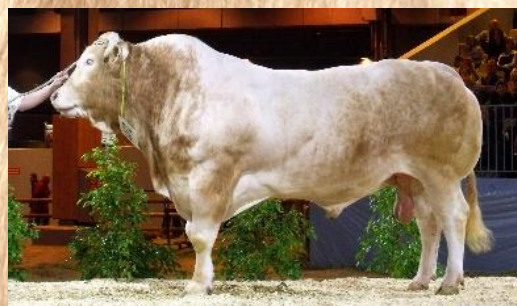
EXODUS Paris 2010

OTTO est le fils du célèbre LEROI, fils de GAILLARD et COCAINE, crème de l'élevage DAYDÉ et côté mère il a aussi de quoi tenir car la lignée EXODUS est la plus remarquable dans l'élevage. IDA, sa mère, a obtenu un pointage de 76A. OTTO est un taureau de 18 mois qui ne laisse pas indifférent, de par son amplitude squelettique , son empattement et sa magnifique couleur de robe . Il est puissant , très régulier dans son bassin et ultra nuancé dans sa couleur . Son atout est aussi sa tranquillité d'esprit, un taureau calme et fonctionnel .